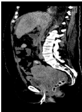
Figura 2. Caso clínico 1: Imagen donde se evidencia tumor ginecológico de gran tamaño. Note las metástasis hepáticas.

resolución progresiva de la insuficiencia renal y es dada de alta a los 5 días para seguir cumpliendo su tratamiento oncológico. Acude a primer control a las 2 semanas encontrándose en buenas condiciones generales.