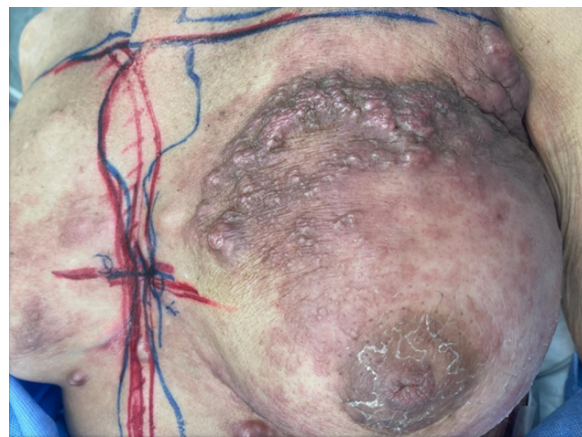
Figura 3. Caso clínico 4: Note la enfermedad axilar con invasión a mama. Se evidencia marcaciones del equipo de radioterapia.

Paciente de 56 años de edad, hipertensa conocida quien refiere inicio de enfermedad actual 4 meses previos a su ingreso, caracterizada por molestias abdominales difusas, gases, dolor intermitente en hemiabdomen inferior, cambio del patrón evacuatorio con tendencia a estreñimiento y aumento de la circunferencia abdominal por lo que acude a esta institución Centro Medico Docente la Trinidad se realiza ecografía abdominal se evidencia hidronefrosis grado III izquierda, se decide intervención quirúrgica por equipo de urología para colocación de catéter doble J unilateral y por cirugía oncológica ginecológica cuyos hallazgos fueron 500 cc de líquido ascítico, enfermedad peritoneal y lesión de ovario izquierdo de aproximadamente 7 cm friable de bordes irregulares; se toman muestras para estudios